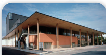
パトリア日田 〒877-0016 大分県日田市三本松一丁目8番11号 TEL.0973-25-5000