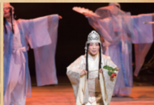
※こちらの写真は2017年度に公演された際の記録写真であり、今回の公演に登場するキャストとは異なります。