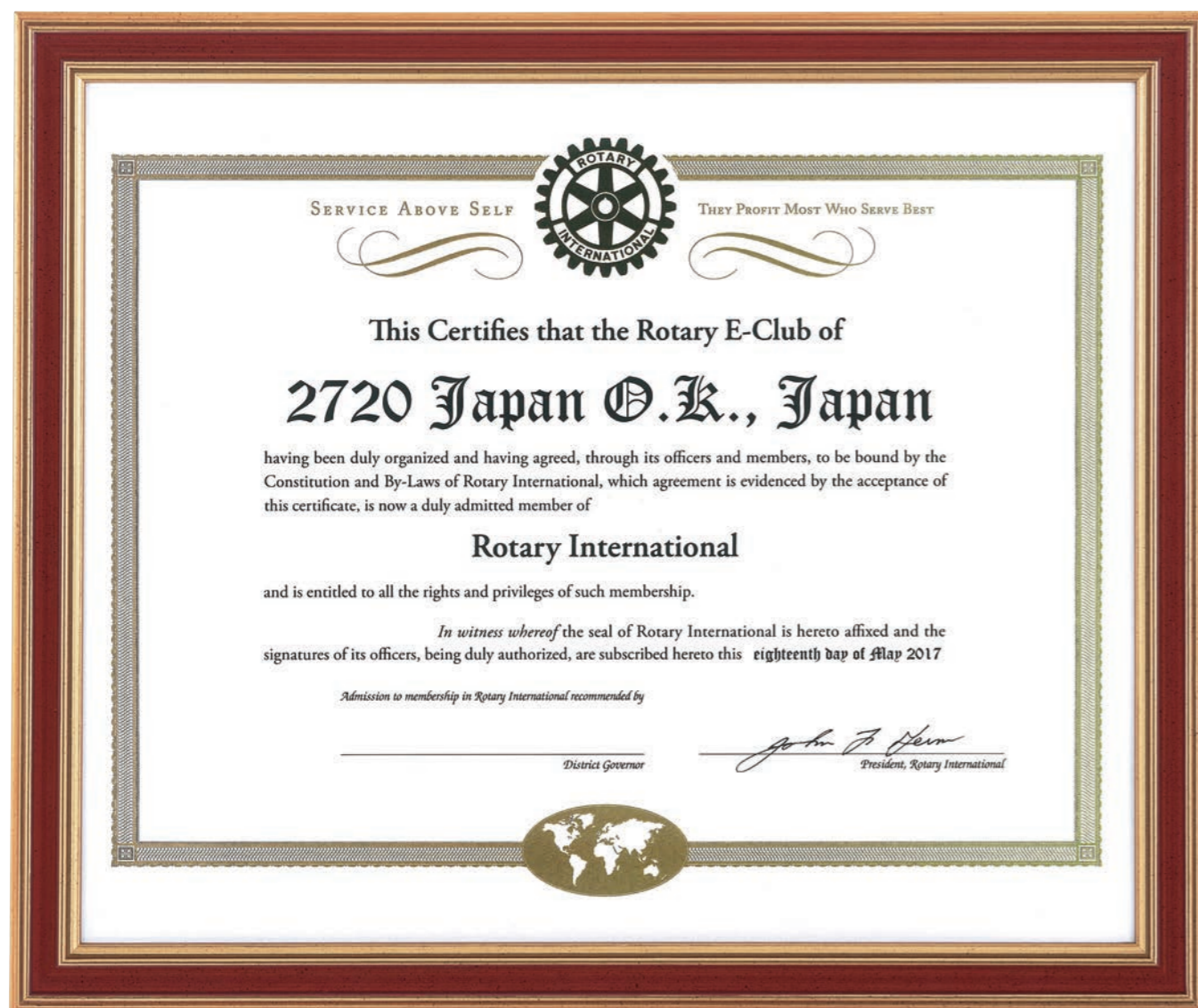
2720 Japan O.K. ローターリーEクラブ認証状